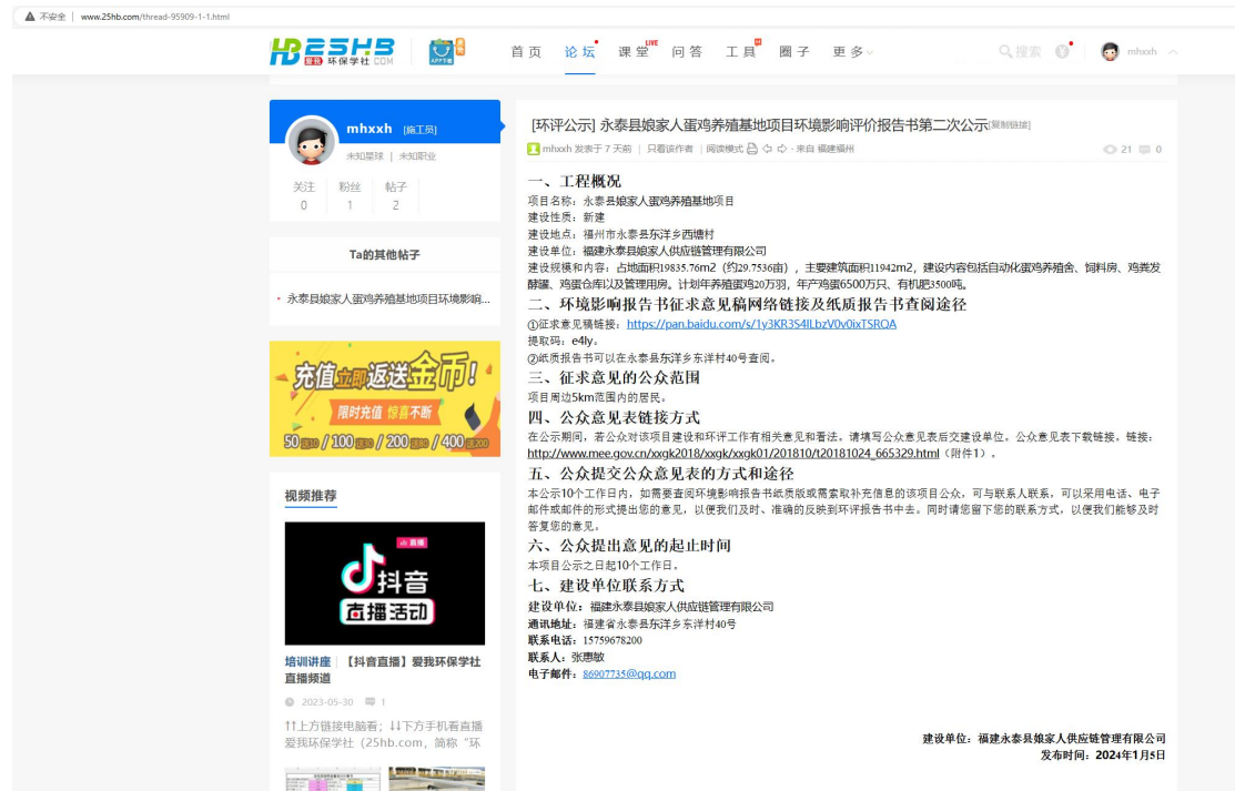
图 3.2-1 征求意见稿网络公示截图

《海峡都市报》属于建设项目所在地公众易于接触的报纸。符合《环境影响评价公众参与办法》（部令 第4号）第十一条的要求。