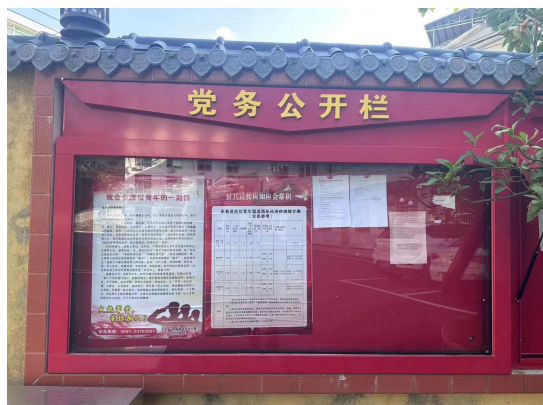
东洋乡公示情况（远景）