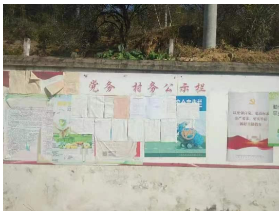
西塘村公示情况（远景）

本次现场公示在西塘村村务公开栏及东洋乡党务公开栏等地点张贴了“《永泰县娘家人蛋鸡养殖基地项目环境影响报告书》（征求意见稿）》公示”，公示期限为 10 个工作日，广泛征求社会各界的意见和建议。本次张贴区域选取在 项目所在地 ，因此符合《环境影响评价公众参与办法》的要求。