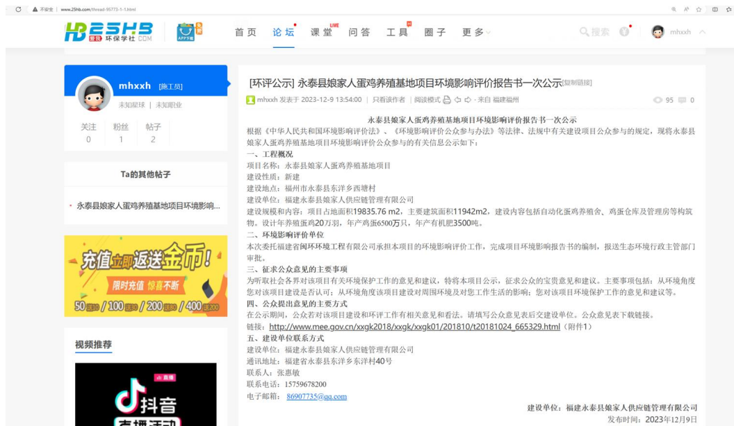
图 2.3-1 第一次公示截图

在本次公示期间，并未收到任何单位或个人关于永泰县娘家人蛋鸡养殖基地项目的电话、传真、信件或邮件等。