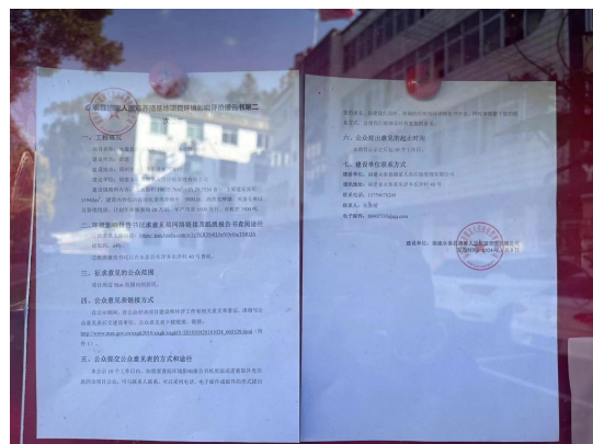
东洋乡公示情况（近景）