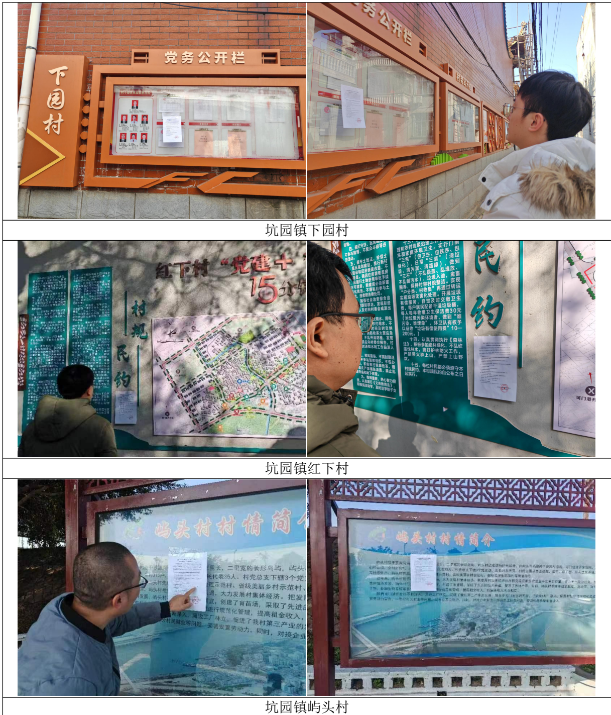
图 3.2-2 张贴公告现场