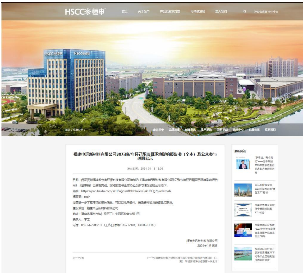
图 4.1-1 报批前公示截图