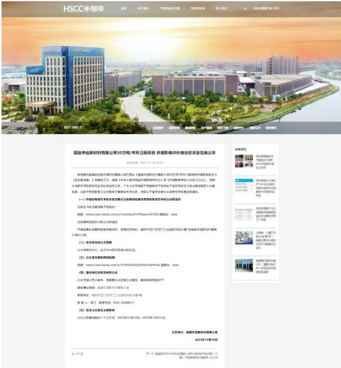
图 3.2-1 第二次网络公示截图